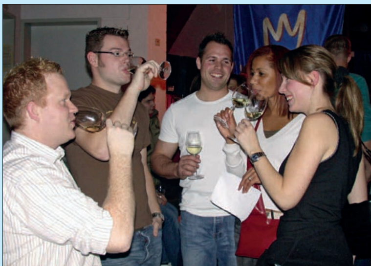
Beim diesjährigen Riesling Grand Prix soll echte „Party-Stimmung“ aufkommen.