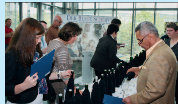
Gastronomen und Winzer bewerten in einer verdeckten Probe die zum Wettbewerb „Der Beste Schoppen“ eingereichten Weine.

Interessierte Gastronomen erhalten im Internet unter www.derbesteschoppen.de detaillierte Informationen und Anmeldeformulare. ■