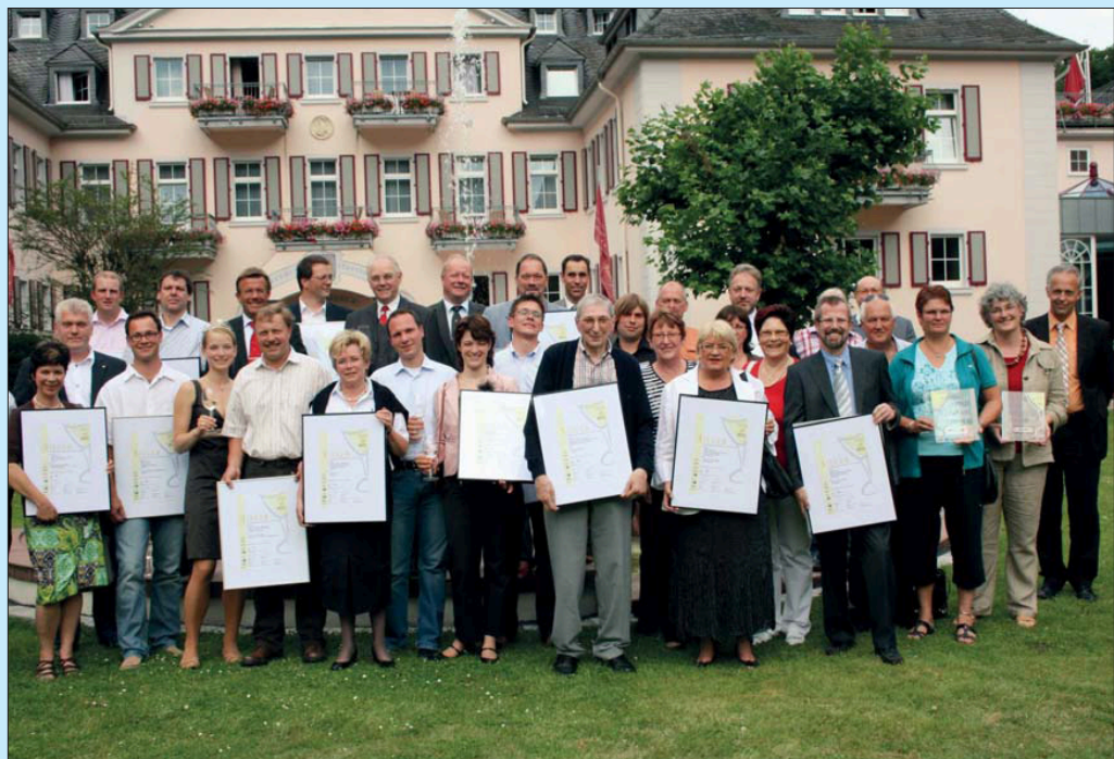
Das Bild zeigt die Siegerwein-Gastronomen mit den Winzern sowie die Vertreter der Organisatoren.

Positiv bewerteten die Wettbewerbsträger besonders die Kooperation zwischen verschiedenen Branchen und Organisationen, die auch einen Grundstein der Regionalinitiative Mosel bildet. Der Dank der Träger galt den Kooperationspartnern, die mit ihrer Unterstützung den Wettbewerb ermöglichen: den Raiffeisen- und Volksbanken der Region sowie dem Gerolsteiner Brunnen. Bei den Proben im Schoppenwettbewerb zeigte sich erneut, dass Gerolsteiner Mineralwasser der perfekte Partner zu den Weinen von Mosel, Saar und