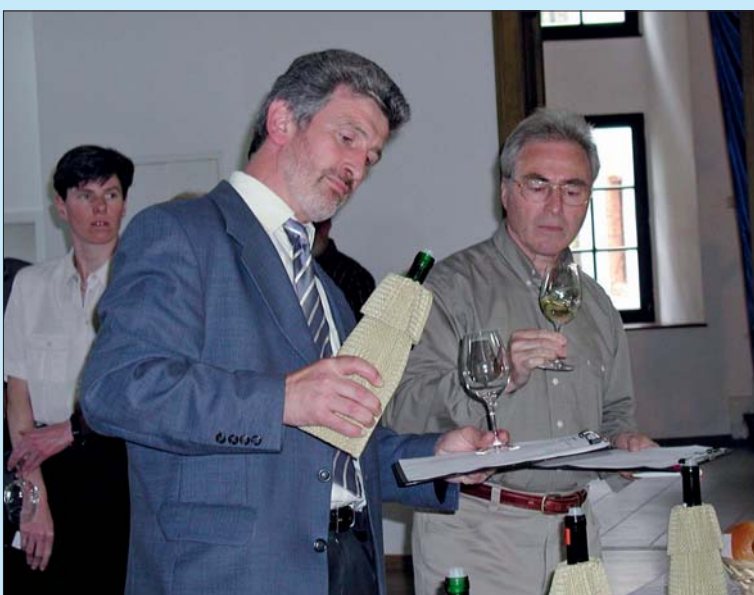
Probe zum besten Schoppen.