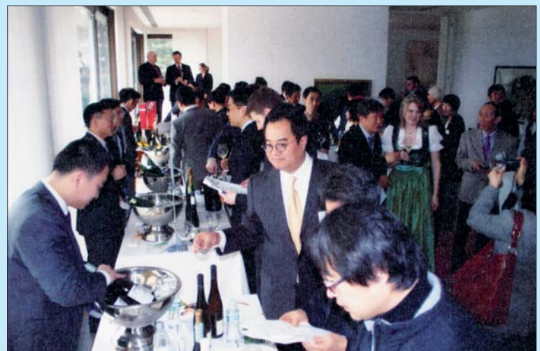
Zahlreiche Importeure, Weinhändler, Sommeliers und Medienvertreter probierten bei der Mosel-Präsentation in der Deutschen Botschaft in Südkorea Steillagen-Riesling.

Neben den bisherigen sieben Kategorien (Elbling trocken, Rivaner trocken, Riesling trocken, halbtrocken und lieblich, Weiße Burgundersorten trocken und Rotwein trocken) wird in diesem Jahr eine achte Kategorie eingeführt – für Rosé, Weißherbst und Blanc de noir bis 18 Gramm Restzuckergehalt pro Liter. Damit wird der zunehmenden Beliebtheit von diesen Weinen Rechnung getragen. In mehreren Regionalproben entlang der Mosel sowie in einer Finalprobe werden die besten Schoppenweine jeder Kategorie ermittelt und zu Siegerweinen gekürt. Alle positiv bewerteten Weine erhalten zu